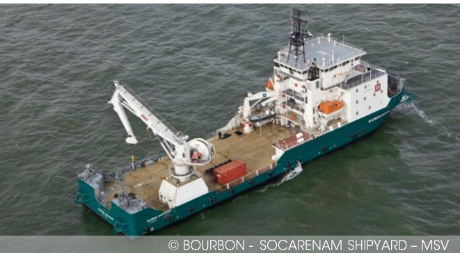
© BOURBON - SOCARENAM SHIPYARD - MSV